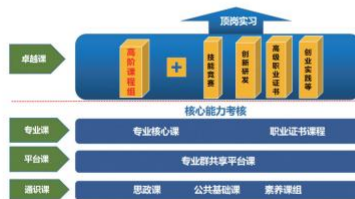
图1 分阶设课, 逐层培养