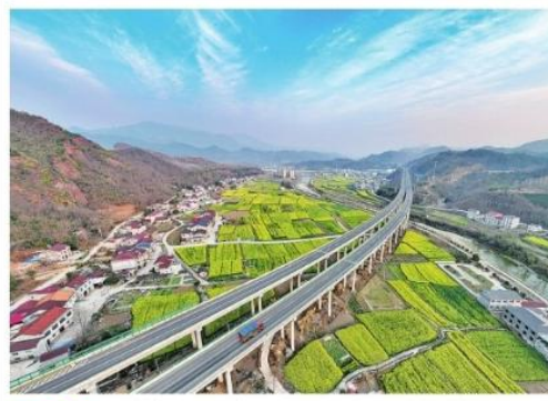
春潮涌动 3月13日, 在湖北省襄阳市保康县马良镇龙桥村, 油区完井初开, 河与路、桥与道, 路桥相连, 构成一幅美丽的乡村田园风光。