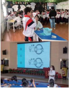
图1 深入中小學校进行视力筛查及科普宣讲

通过筛查,对视力异常的学生给予科学的矫正指导,对于有近视趋势和近视发展较快的学生进行分析和总结,编写《青少年近视防控科普宣传手册》,结合实际案例进行近视防控专业讲座,指导中小學生科学用眼。